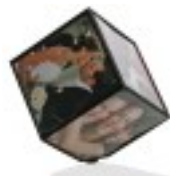
Foto-Würfel rotierend für 6 Fotos Nr. 73514