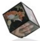
Foto-Würfel rotierend für 6 Fotos Nr. 73514